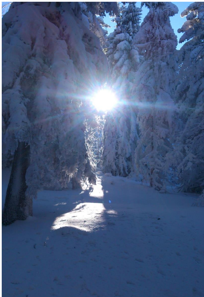
Krása v Beskydech