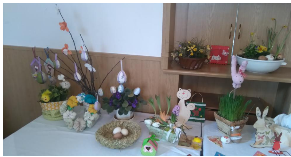
Velikonoční výstava v Obecním domě.